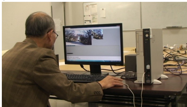
図 3 クライアントの操作の様子

実験は TravelProxy のことを全く知らない外部の被験者 1 名と、研究室の学生 4 名にクライアント役として協力を依頼した。プロキシは神奈川県横浜市のみなとみらい地区を探索し、クライアントはカメラを通して命令を送り、プロキシを操作した。以下の図 3 に実験の様子を示す。